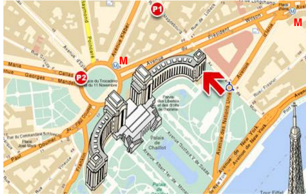
Accès de l'auditorium 7 avenue Albert de Mun 75116 Paris