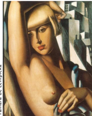
Tamara de Lempicka