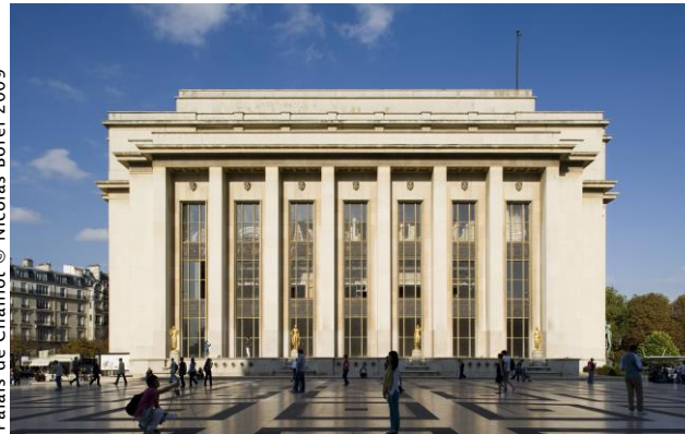
Palais de Chaillot

« 1925, quand l'Art Déco séduit le monde »