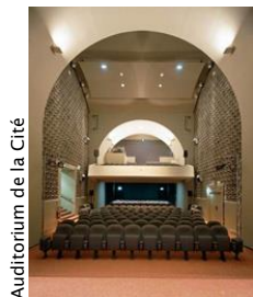
Auditorium de la Cité

Par une meilleure compréhension des obligations et spécificités de chacune d'elles, les participants à ce Congrès pourront apprécier ce qu'il y a de commun dans la pratique de ces expertises au regard des missions confiées et, qui sait, peut-être, abandonner quelques préjugés.